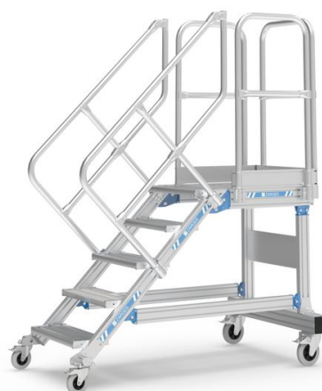
Plate-forme d'accès ou de travail mobile, avec montée confortable. Idéale pour les travaux de longue durée, également avec outils et changement fréquent du poste de travail. Plate-forme spacieuse avec garde-corps pour un travail sûr et ergonomique en hauteur.