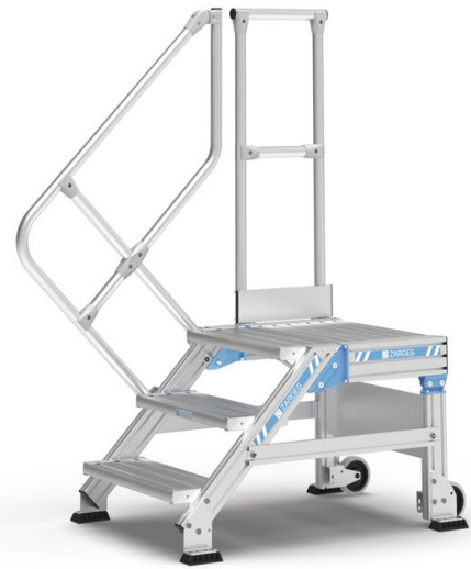
Plate-forme de travail compacte offrant une montée confortable. Choix entre les versions fixe et mobile (permettant un transfert rapide vers un autre poste de travail). Idéale pour les travaux de longue durée, également avec outils.