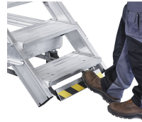
Plate-forme d'accès ou de travail mobile, avec montée confortable. Idéale pour les travaux de longue durée, également avec outils et changement fréquent du poste de travail. Plate-forme spacieuse avec garde-corps pour un travail sûr et ergonomique en hauteur.